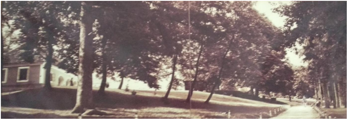
Korai kép a kastély kapujából készítve

Lesencetomaj központi részén, a felső buszmegálló közvetlen szomszédságában nyílik a Veszprém Megyei Fogyatékos Személyek, Pszichiátriai és Szenvedélybetegek Integrált Intézménye 5. számú telephely kapuja. A kapuban portaépület fogadja az érkezőket. Az intézmény parkjában áll az utcáról is jól látható Kastély, és a mellette álló Palás épület.