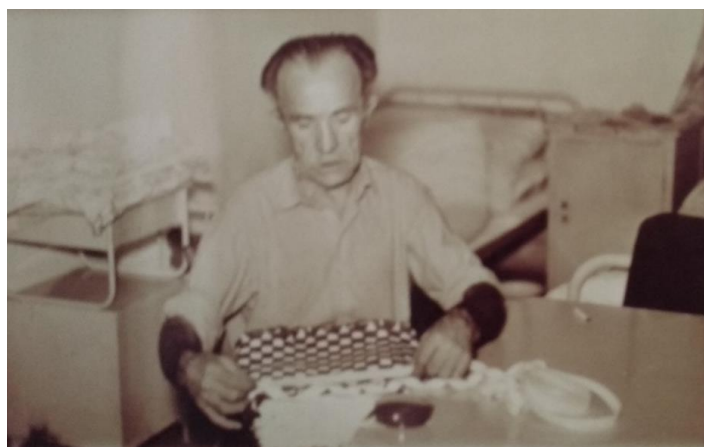
Fonott táska készítése