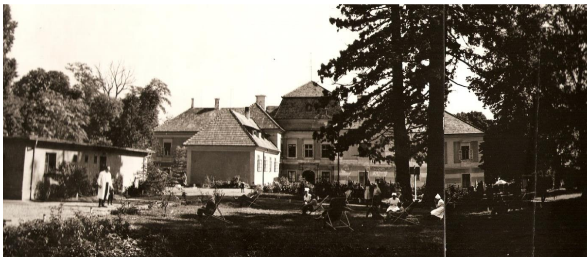
Pihenés a parkban