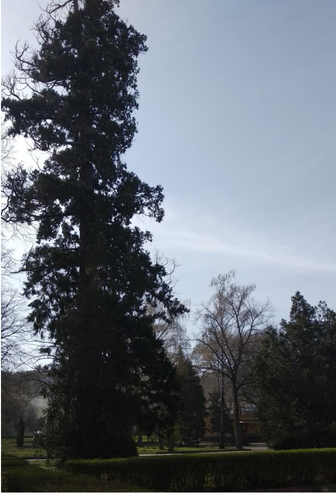
Az intézmény parkjában álló védett mamutfenyő