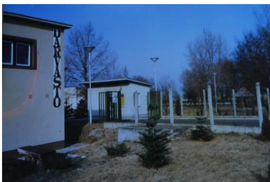
Az intézmény bejárata