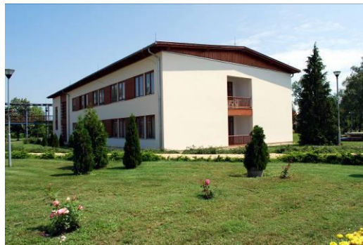
V-VI -os gondozási egység épülete

2007 szeptemberében az Intézetben új szabadidőparkot avattak. Benne gyepszőnyeges labdarúgópálya, bocsa és petanque pálya, rekreációs park áll a lakók rendelkezésére. 2018 – ban a hitélet támogatására a szabadidőparkban lehetőséget teremtettek a különféle felekezethez tartozó lakók számára az elmélyedésre.