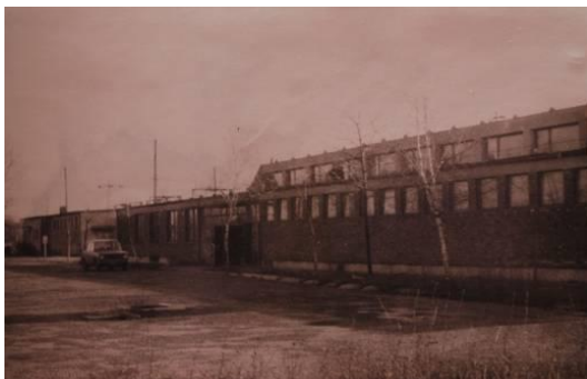
Üzemi épület (étkező, konyha, mosoda, kazánház)