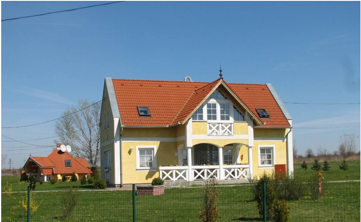
A Félúton Házak egyike, háttérben, az azóta lebontott kiszolgáló épülettel.