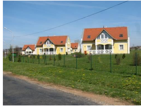
Félúton házas ellátás

Az intézmény jelenleg 279 férőhellyel működik. A férőhelyek kihasználtsága az alapítástól kezdve megközelítőleg 100%-os, amely igen kedvező.